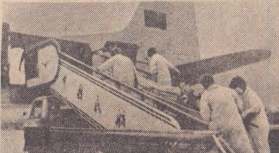
中国民航の救援機に遺体を運び込む係員たち(桂林空港で)