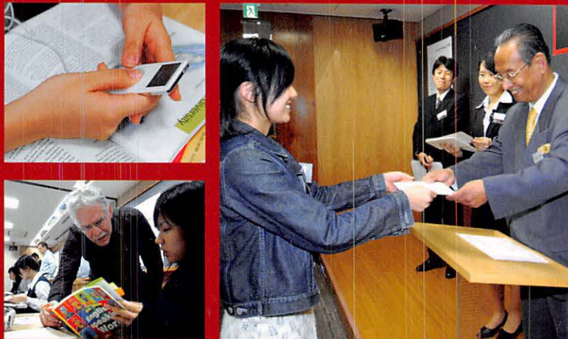
Super English Workshop