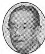
なかじま 尚宏 国際教養大学学長